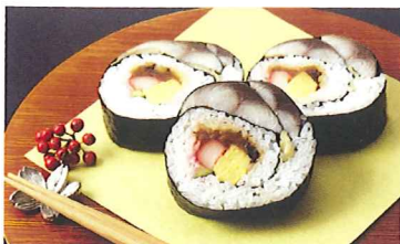
受賞した「とろ鯖 大名巻」

豊中の街で、地域一番店を目指し、日々様々な活動に取り組んでいる中、今回マルシェカップで最優秀賞を頂けたのは、鯖やにとって最高に嬉しいことです。マルシェカップの為に開発した「とろ鯖大名巻」は、今では鯖やの看板メニューまでに育ちました。マルシェカップに心より感謝しています。